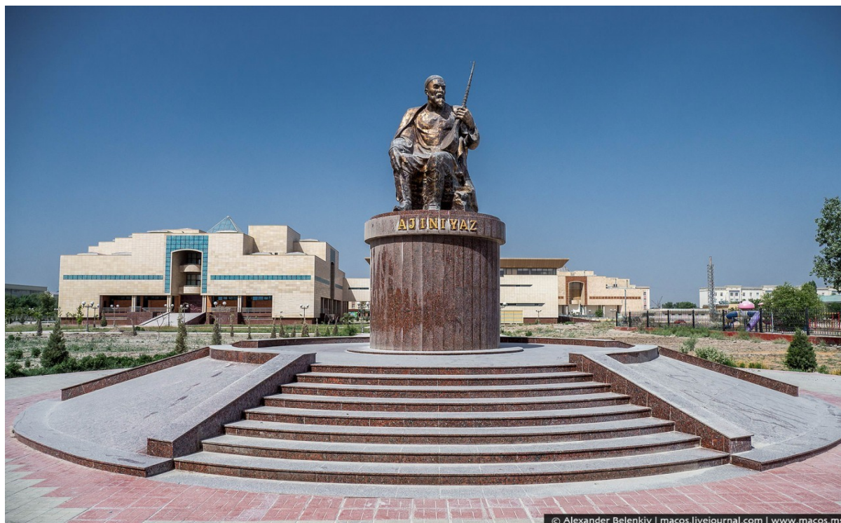
(Нөкис қаласының орайында орнатылған Әжинияз бабаның естелиги)

Мақтумқулының көп ғана қосықтарын қарақалпақ тилине аударған. Хәтте айырым қосықтарын өз дәретпесине қосып кеңейтип жазған.